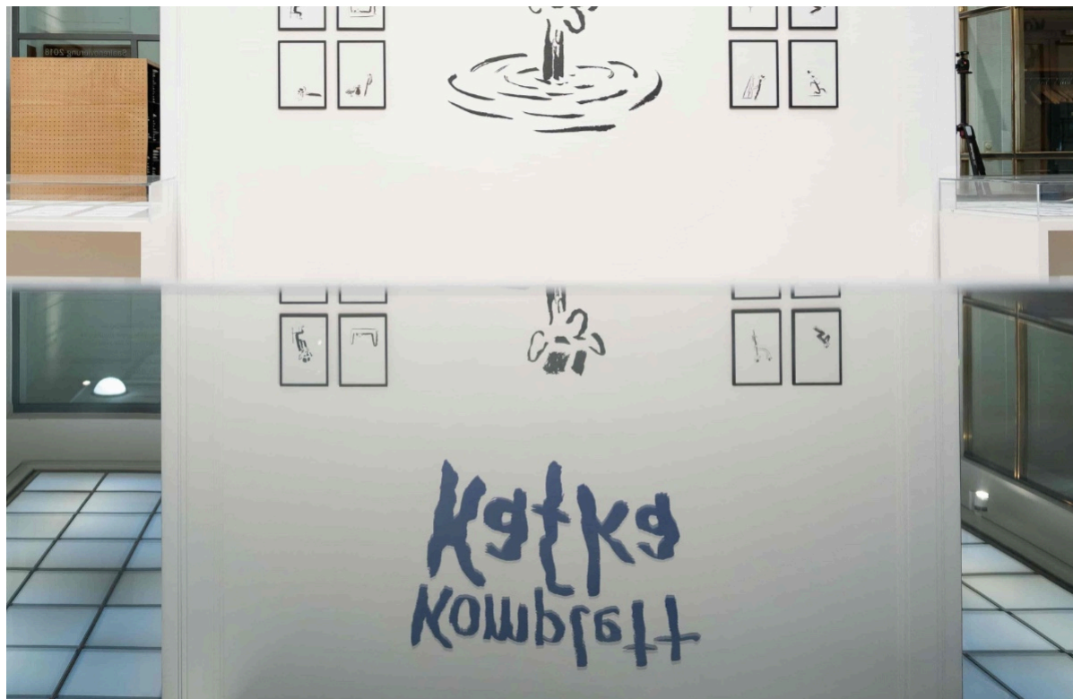
Komplett Kafka: © Nicolas Mahler