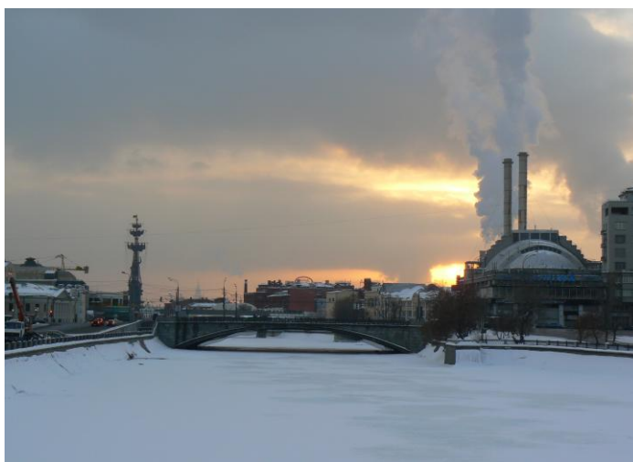
1 Zimní Moskva

Z letiště Šeremetěvo, na které jsem přiletěla s Českými aeroliniemi, jezdí do města vlak Aeroexpress. Na Běloruském nádraží, kde vlak svoji cestu končí, může na stipendistu po domluvě čekat auto z Velvyslanectví ČR a odvézt jej na univerzitní koleje. V případě, že této