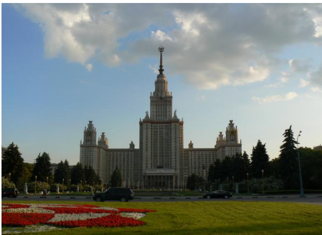
2 Moskevská státní univerzita (MGU)

Zahraniční studenti bydlí v různých sektorech při hlavní budově MGU, nejvíce jich je však ubytováno v sektoru V na 6. a 7. poschodí. Vždy dva studenti obývají jednu buňku, která se skládá ze dvou pokojů, sociálního zařízení (sprcha, umyvadlo, wc) a předsíňky. Pokoje obsahují základní vybavení – stůl, židli, skříň a postel. Na tu jsem si nemohla po celou dobu pobytu zvyknout, protože byla příliš úzká a matrace svým vzhledem vypovídaly o svém stáří. Přehodila jsem přes ně proto svůj spacák, jenž sloužil jako izolace, a celých pět měsíců jsem na něm spala.